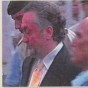
মিথ্যা মামলার আসলতে নেতা হচ্ছে হারুন ইয়াহিয়াকে

হারুন ইয়াহিয়া তুরেকের আংকারায় জন্মগ্রহণ করেন ১৯৫৬ সালে। হারুন ইয়াহিয়া নামে তিনি সুপ্রসিদ্ধ হলেও, এটি আসলে তাঁর ছদ্মনাম (pen- name) তাঁর পিতৃপ্রদত্ত নাম হচ্ছে আদনান ওকতার (Adnan Oktar)